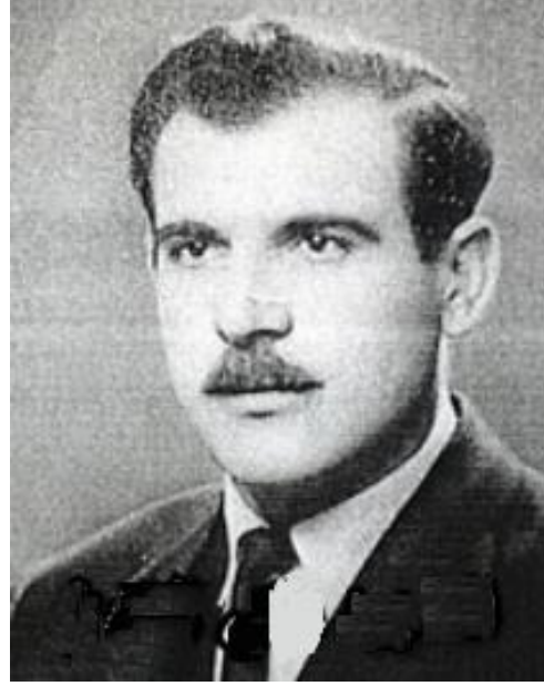
الشهيد متي الشيخ

والاقطاع. إنها تحمل راية معاداة الشيوعية والديمقراطية والوطنية، راية ميثاق بغداد وغلاة دعاة الاستعمار والعدوان والحرب وفرض ايشع اساليب الحكم البوليسية الفاشية على البلاد. إنها تحمل راية تدمير جيشنا الوطني جيش 14 تموز وتصفية عناصره الوطنية الأشد اخلاصاً للشعب والوطن. إنها سلطة معادية للقوميات والاقليات التي يتألف منها شعبنا، سلطة تحمل راية العداء القومي والطائفي ضد الشعب الكردي وضد الاقليات القومية والدينية والطائفية، انها تحمل راية معاداة العمال والفلاحين والمتقنين ومعاداة الثقافة والعلم". وجاء في الرسالة أيضاً: "ولا يحتاج الى برهان جديد بأنه من المستحيل فرض حكم غادر على الشعب بالحديد والنار وباساليب الاعتقال والتشريد والقتل الجماعي. إن الشعب لا يمكن افناؤه او فل ارادته. إن المغمورون والخونة الذين يحاولون حكم الشعب رغم ارادته، هم الذين كان مصيرهم على الدوام الفناء والدمار. وسيجد الفاشست الانقلابيون الجدد المنزلون كلياً عن الشعب مثل هذا المصير بصورة عاجلة وسريعة بشكل استثنائي".