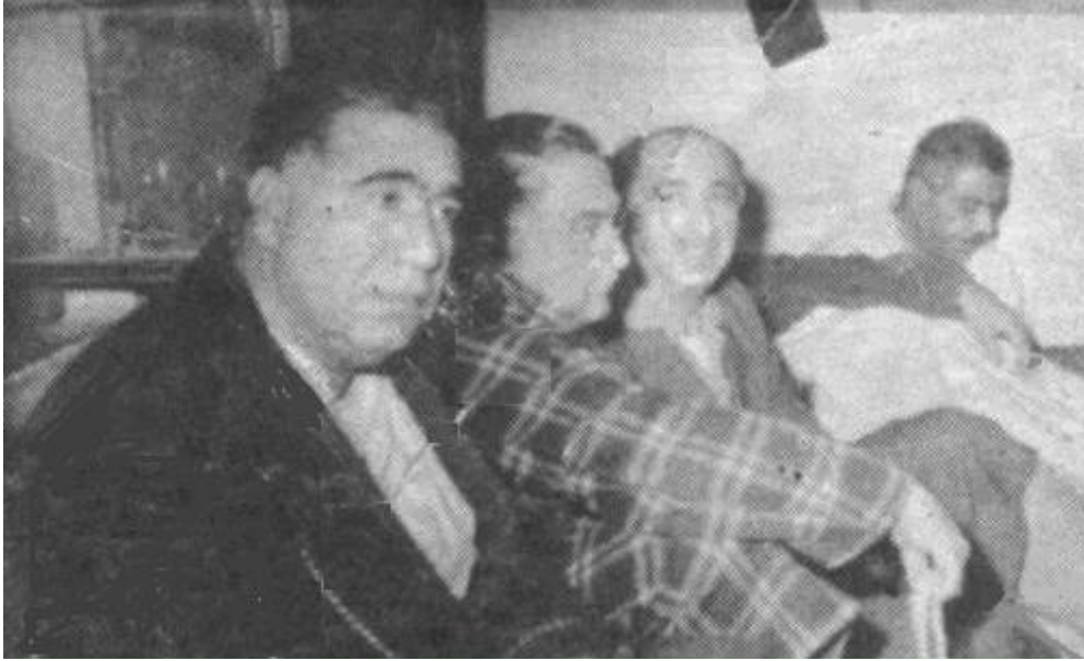
وزراء ثورة تموز في سجن انقلابي 8 شباط 1963

السوفييتي إلى شن حملة واسعة لفضح الانقلاب في الاعلام مما ترك أثراً كبيراً سواء في داخل الاتحاد السوفييتي أو خارجه. وحذت جميع الأحزاب والقوى التقدمية حذو الاتحاد السوفيياتي والأحزاب الشيوعية والتقدمية باستثناء الحزب الشيوعي الصيني وحزب العمل الألباني والأحزاب التي تسير على نهجهم. وأتذكر إننا في أحد الايام قمنا بسفرة نهريه خارج موسكو، وكنا جالسين حول مائدة وعلت وجوهنا إمارات الحزن الشديد على الوطن المستباح وضحايا رفاقنا وشهدائنا، وبكىنا بكاءً مراراً. وإذا باحد العمال الروس الذي يعمل في احدى المعامل الكبيرة، يتقدم إلينا ويسألنا، ما بكم ومن أين انتم؟ فأجبناه إننا عراقيين وهذي مصيبتنا. فقال إنني أعرف بما أصابكم.... وبدأ هو الآخر بالبكاء وقال لقد طلبت التطوع ورفضوا، وبعدها قدمت راتبي تبرعاً للمناضلين العراقيين، فرفضوا هذا ايضاً!!!. أرجوكم ان تأتوا معي وتأخذوا راتبي تبرعاً. وأجهش بالبكاء، وقمنا جميعاً الى تهدئته وعزفنا نحن عن البكاء، ولكن بدون جدوى. هكذا كان شعور الشعب السوفييتي وكان دورهم متميزاً .