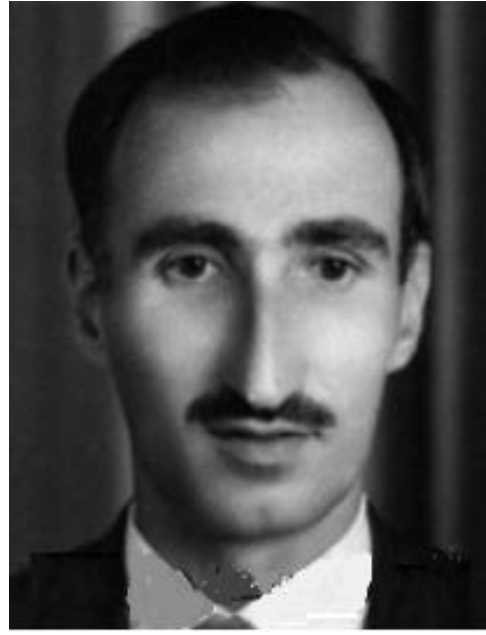
الشهيد ابراهيم الحكاك

مكتسبات ثورة 14 تموز. إنها تحمل راية مهادنة الأستعمار الامريكي والانكليزي وشركتهما النفطية. إنها تحمل راية تخريب البقية الباقية من النزر اليسير من حريات الشعب ومنظماته ونقاباته وجمعياته المهنية والثقافية والاجتماعية. إنها تحمل راية تخريب المقاييس الوطنية وتشويه أهداف الحركة الشعبية وحررها لصالح الاستعمار