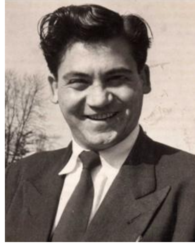
الشهيد الرئيس هشام اسماعيل صفوت