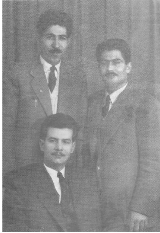
الشهداء سلام عادل وجمال الحيدري