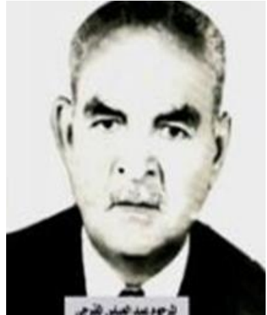
سائق القطار الشهم