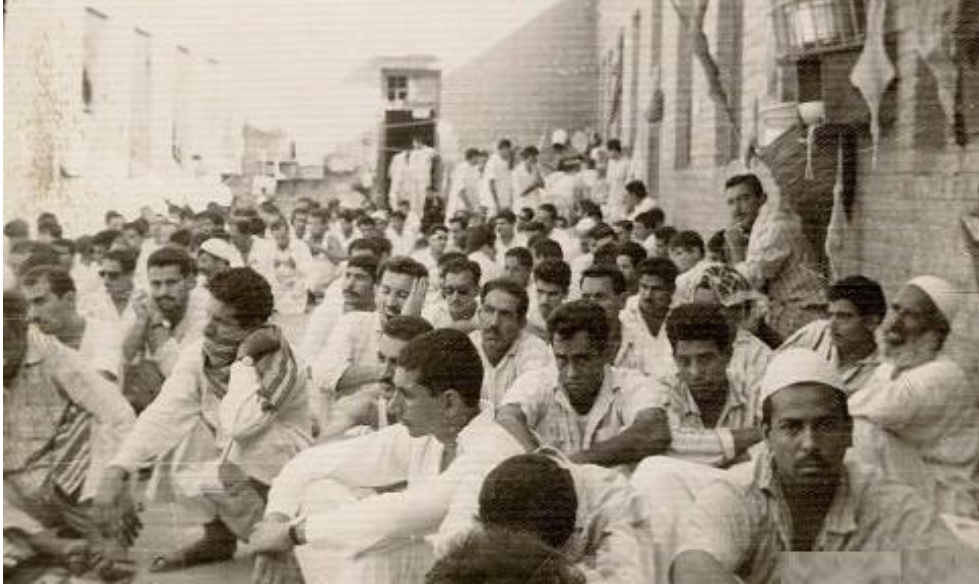
ضحايا انقلاب شباط في سجن مدينة الحلة