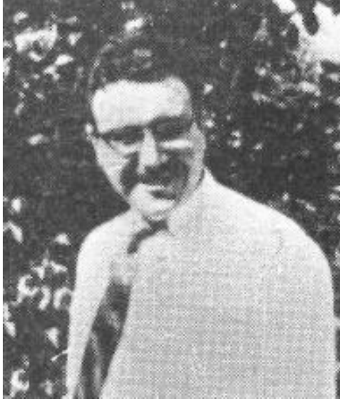
الشهيد نافع يونس

ولا بد لي أن أورد في هذا الإطار مقتطفاً من رسالة الشهيد سلام عادل التي وجهها إلى لجان المناطق والمحليات قبل اعتقاله بأيام تقييماً للانقلاب الفاشي حين قال: "ان الدكتاتورية السوداء الجديدة لم تأتي للقضاء على الدكتاتورية الفردية كما تزعم، ولم تأت من أجل تحقيق الوحدة والحرية والاشتراكية والعدالة الاجتماعية. ان طبيعة الدكتاتورية السوداء الجديدة لا يمكن سترها بغربال من الديماغوجية والتهويز. إنها ذات طبيعة رجعية قومية يمينية شوفينية عنصرية طائفية، وطبيعتها هذه تخدم بالدرجة