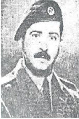
الشهيد ابراهيم كاظم الموسوي