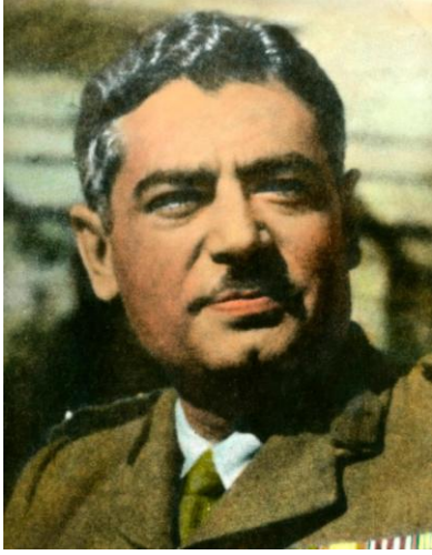
الشهيد الزعيم داوود سلمان الجنابي