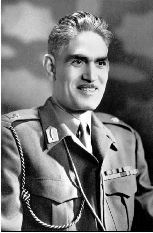
الشهيد الزعيم عبد الكريم قاسم

ومطالبة الاحزاب بعقد اجتماع لقيادة الجبهة من أجل دراسة مستقبل الثورة وأفاقها وتطوراتها. ومع الاسف ان الاحزاب المساهمة في الجبهة اهلكت الدعوة، كما أشرت سابقاً. ووجد التيار القومي أن الفرصة غدت سانحة للإطاحة بالحكم الوطني عبر تشكيل جبهة تضم البعثيين والقوميين إلى جانب ممثلي الاقطاع والرجعيين والعملاء وبدعم خارجي تحت شعار "يا اعداء الشيوعية اتحدوا". وهذا ما اثبتته انقلابهم الاسود الدامي في 8 شباط، والذي وصفه سكرتير حزب البعث آنذاك صالح السعدي بأنهم جاءوا بقطار أمريكي.