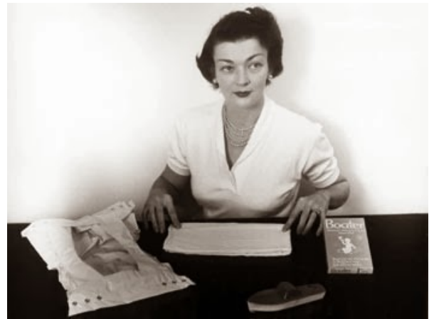
2 - حفاظات الأطفال، ماريون دونوفان

"ماريون دونوفان" عرضت لأول مرة إختراعها للحفاظات في متجر "ساكس فيفث أفينيو" في أمريكا